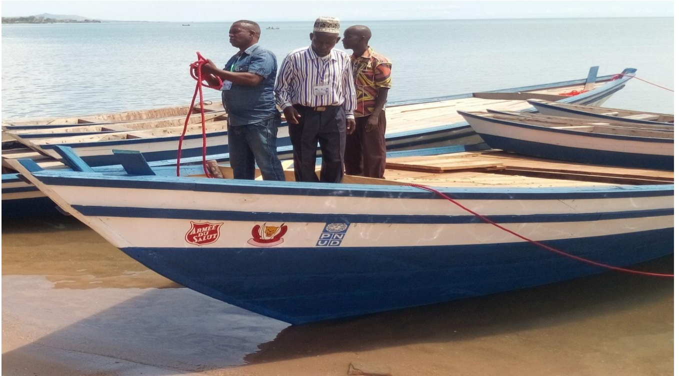
Vue de loin pour les pirogues de deux équipes