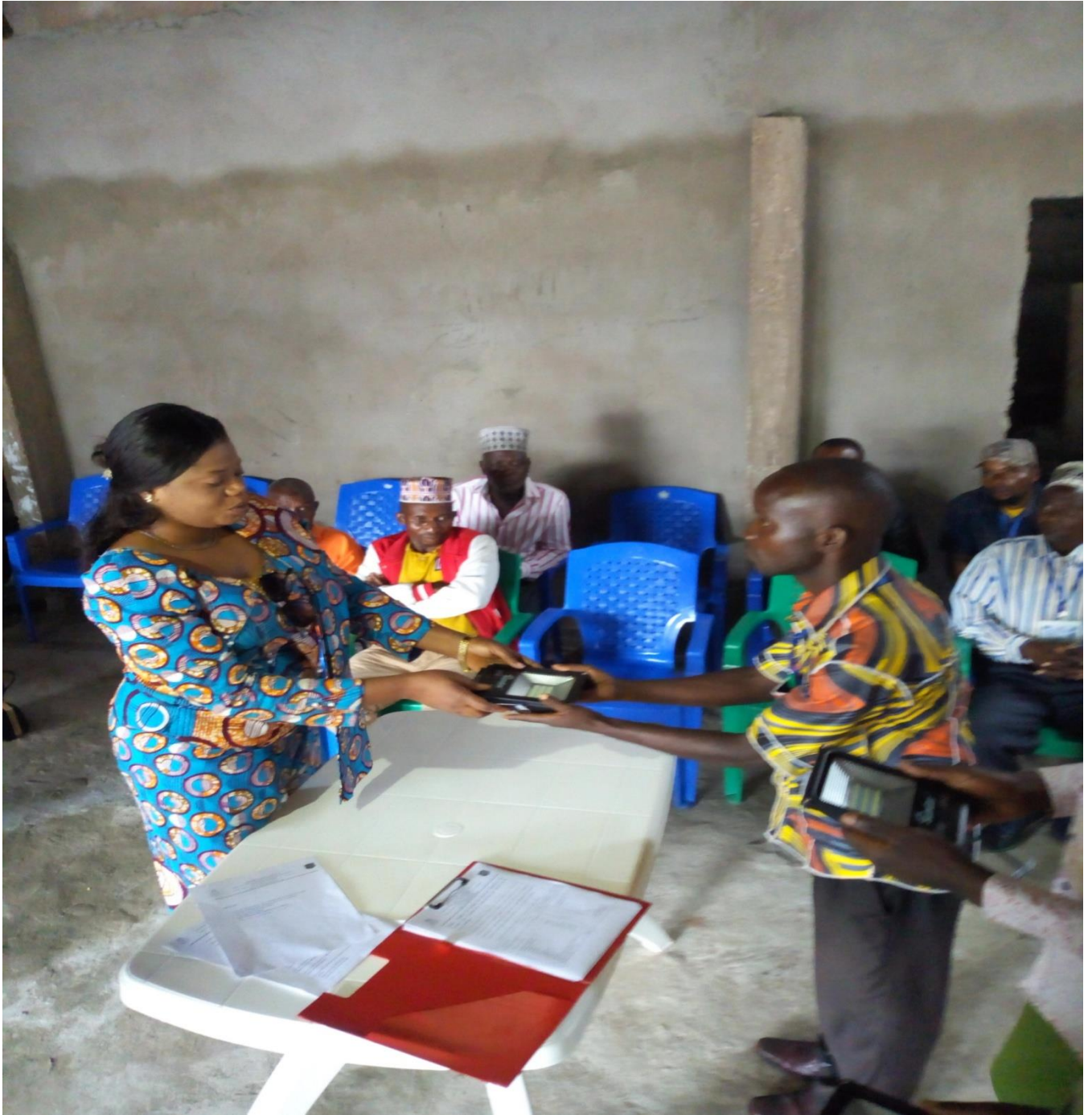
Remise symbolique par Excellence madame le Commissaire pêche et élevage du Tanganyika.