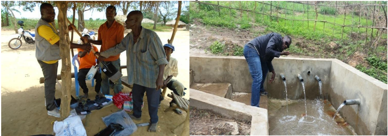
La distribution des kits d'aménagement