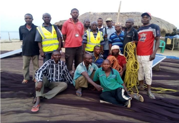
Les pêcheurs de Kasenge