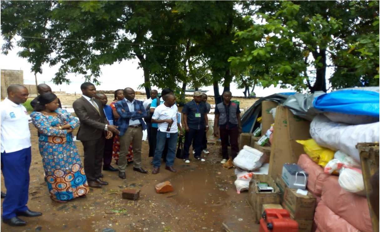
Présentation des intrants de pêche au Gouvernement provincial et bénéficiaires