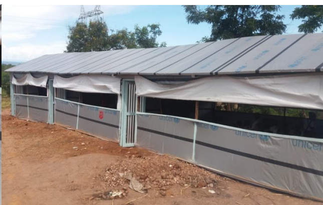
Les classes temporaires d'urgence