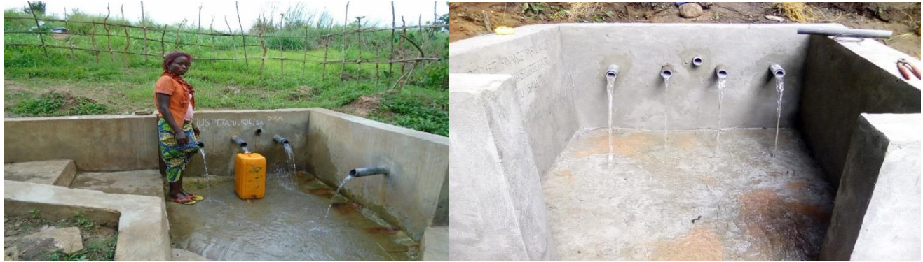
Sources reamenagées et réhabilitées

d'assainissement pour assurer l'entretien régulier des ouvrages. Toutes les activités du projet se sont passées dans le calme et les objectifs assignés ont été atteints.