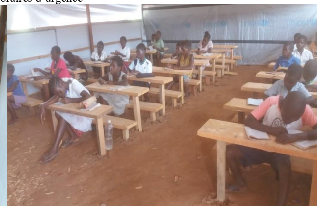
Bancs fixes d'urgence