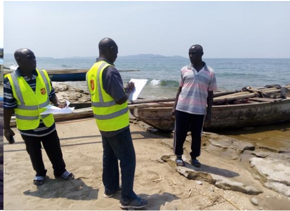
Identification des pêcheurs