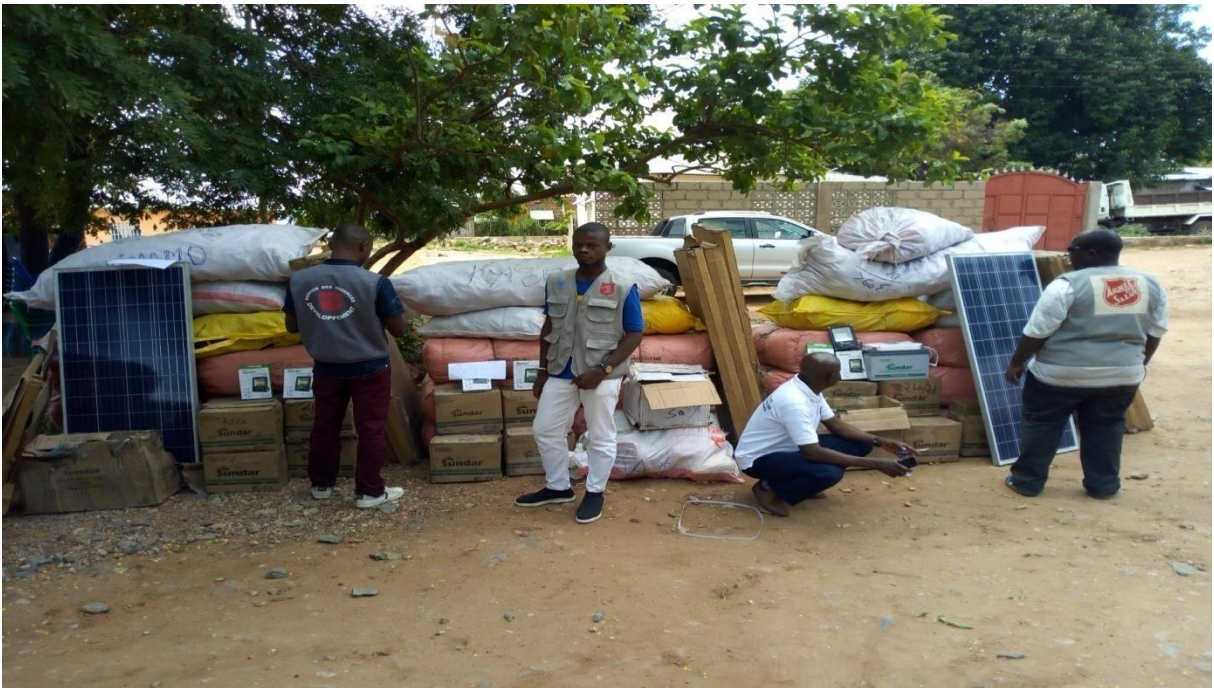
Les intrants de pêche pour les 3 équipes