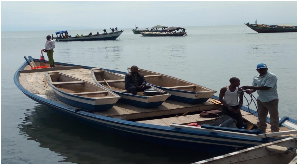
Vue de loin d'une grande pirogue avec 3 petites de renfort pour une équipe.