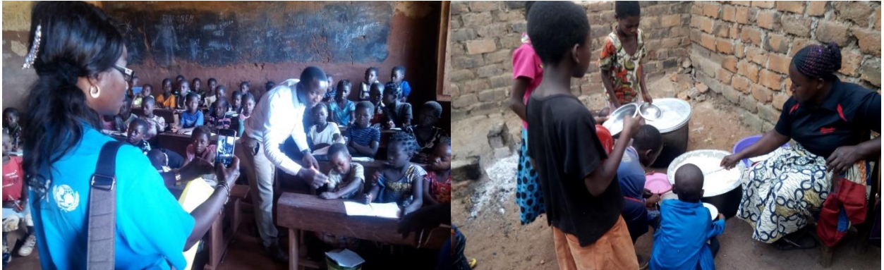
« Visite de l'agent Unicef et la distribution d'un repas scolaire aux écoliers »