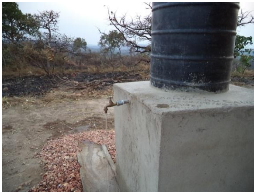
Point de lavage des mains installé à l'E.P.Bisibo