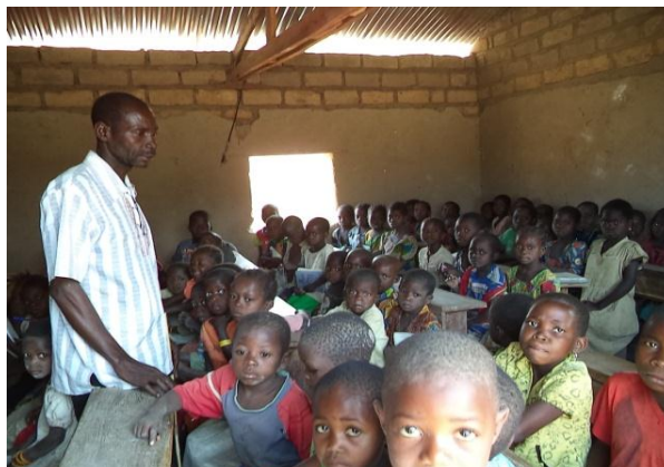
Les élèves suivent le cours de la remise à niveau