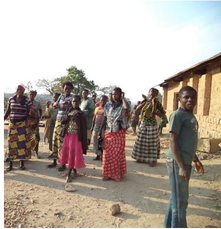
Membres du club de jeunes de Kambilo