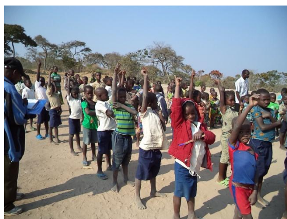
Les élèves déjà inscrits pour la remise à niveau