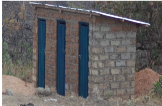
Portes de latrine construites à l'E.P. Bisi