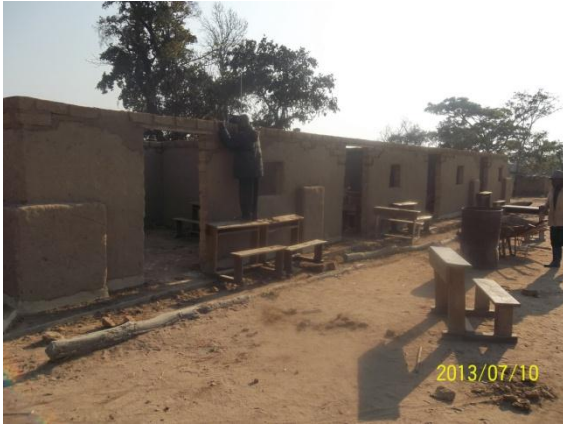
Salles de classe avant rehabiliation