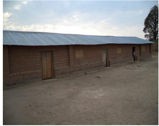
Salles de classe apres rehabiliation