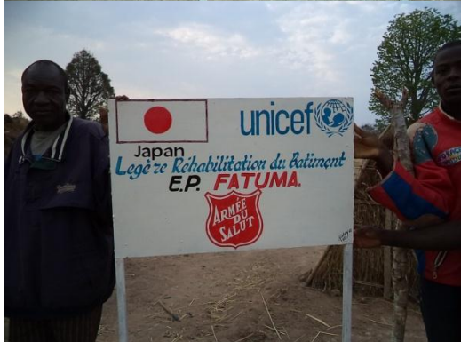
Modele de visibilité installée dans chaque école